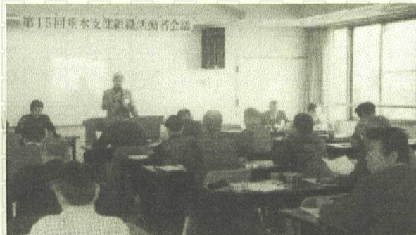
熱心に討議中の参加者の皆さん

組合で確定申告相談をされた方は、4日間です。207名でした。皆様ご苦労さまでした。