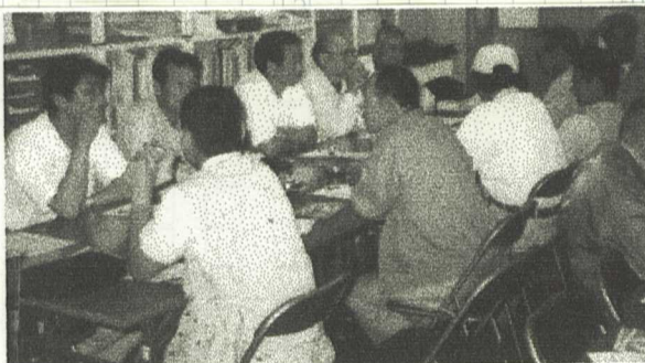
5月13日組織推進委員会開催

各分会目標 支部目標 ○第一分会 3名 合計 39名 ○第二分会 4名 ○第三分会 4名 目標達成に向けて、より一層のご努力をお願いします。