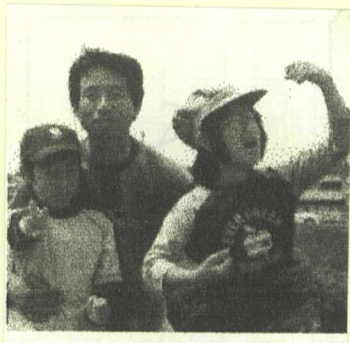
葛本さんファミリー