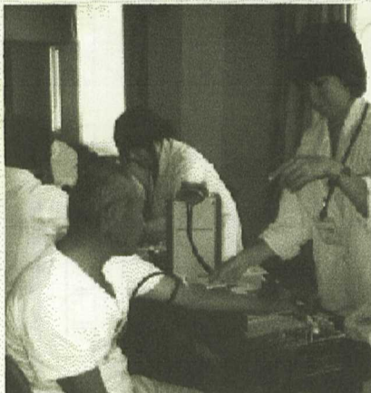
ちょっとチクツとしますよ!