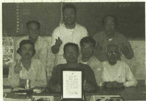
教官部員全員集合 秀賞をめぐり りますので みなさまの 力強い協力 をお願いします。

二〇〇三 年度の機関 紙コンクー ルにおいて垂水支部 の機関紙が初めての 優秀賞を取りました。 さらに最優