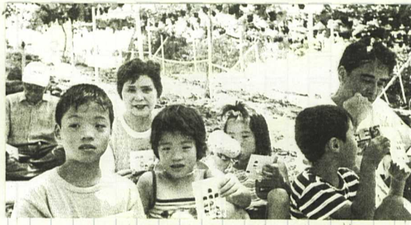
うん、もうちょっとでビンゴだよん

【高原通信員】二〇〇三年、青年部主催のぶどう狩りが、西区の神出ぶどう園で開催されました。参加者は