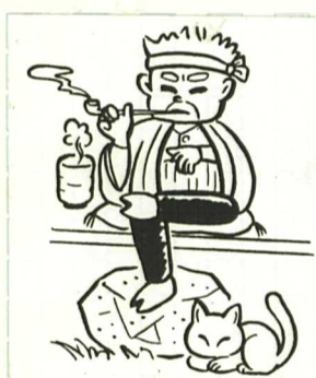
親方になりたいよ～

二百四名が受診され ました。 何も無いのが当た りませえ! 自分自身の健康を確 認し、来年も元気に 健康診断でお会いし ましょう。