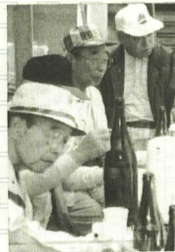
うん おいしかたな.