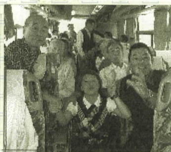
車中の研修会も無事終了

平成15年10月19日(一日)から20日(二日間)好天に恵まれて、南紀の勝浦温泉においでした。研修会が可能な中、勉強会の後、勝浦温泉のホテル中の島で、雄大な黒潮の流れと心地よい潮騒につつまれた露天風呂を除いた後、懇親会が開かれ非常にたのしかった。