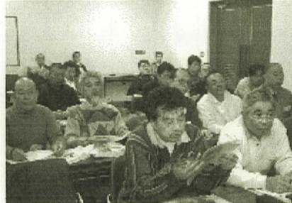
真剣に討議中の支部参加者

1月18日、19日に、表記の会に参加しました。29支部から102名、本部・支部・事務局合わせ、122名の参加でした。