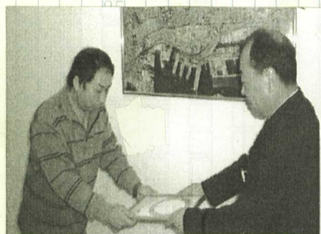
中央消防署署長室にて