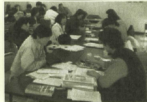
確定申告相談会場

毎年2月になると、 うっとおしい気分にな ります。 税金 の申告 が近づ いてき ている のです。 外は寒 いさむ い北風 が吹いています。いや いやながら組合の申告 会場へと向かいます。