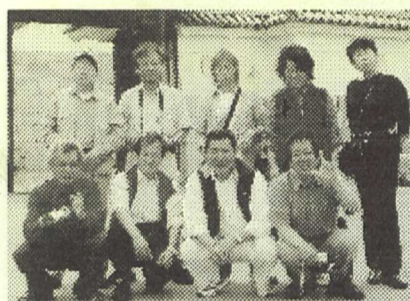
生徒の皆さん 春の遠足で記念撮影