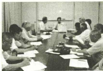
西垂水公館にて第13回総会開く。