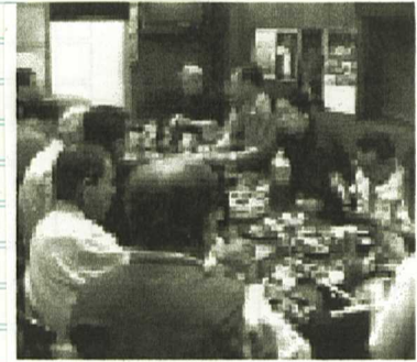
第一分会総会・さつきにて