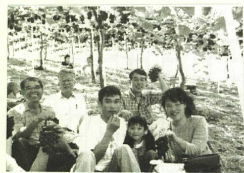
ぶどう狩りの楽しいひととき 神出ぶどう園

「本田義 洋通信員」 8月29日(日) ぶどう狩りを楽し みました。 参加者は大 人8名とか