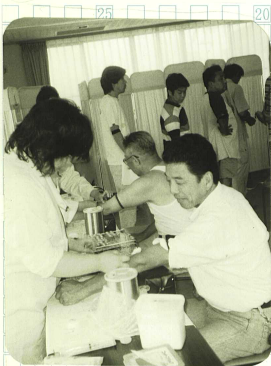
おてやわらかに お願いします

今年も、230人の 申し込みでした。賑は ぬ先の杖。日頃は忘れ がちな体を見詰め直す 日。そう、年に一度の 組合の健康診断です。