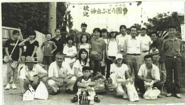
第4分会の皆さん 神出ぶどう園

「吉田照明通信員」 9月5日(日)分会の レクリエーションを神 出ぶどう園にて盛大に 行ないました。参加者 30名でした。好天にも