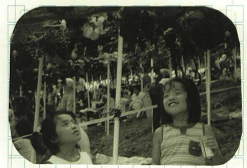
どれにしょうかな～

10 いましたところ、時が 経つにつれて天気も良 くなり現地の神出ぶど う園は大変なにぎわい を見せていました。 参加者は大人が30人 と小人が12人でした。 昨年と比較して今年 は連日の暑さでぶどう の糖度が増して甘くて おいしいぶどうをお復