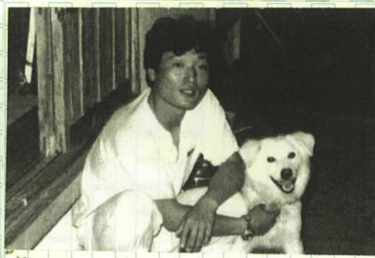
慶良間にて、「映画マリリンに会いたい」で有名な名犬 シロと。

5 「あゝ寒い」パッチに防寒着の季節がやってきました。 私には飽気屋をやっています。