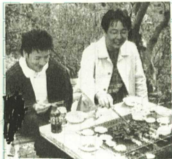
話しがはずみです

1 「松岡成 幸通信員」 皆さんお元 気ですか。 季節の変わり 目で疲れて いませんか。 しょうぬ。 ところで