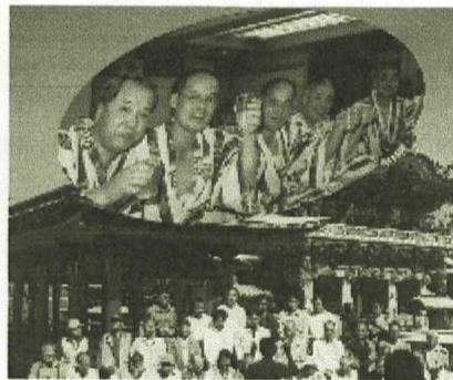
色々な楽しみも・・・