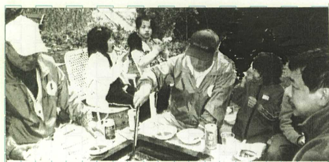
うーん もうお腹いっぱいだなー

疲れのメカニズムを解 明する研究が新聞に載 っていました。 それによると免疫神 経・内分泌のバランス がくずれて発症する慢 性疲労症候群という病 気があります。 この病気は次の事項