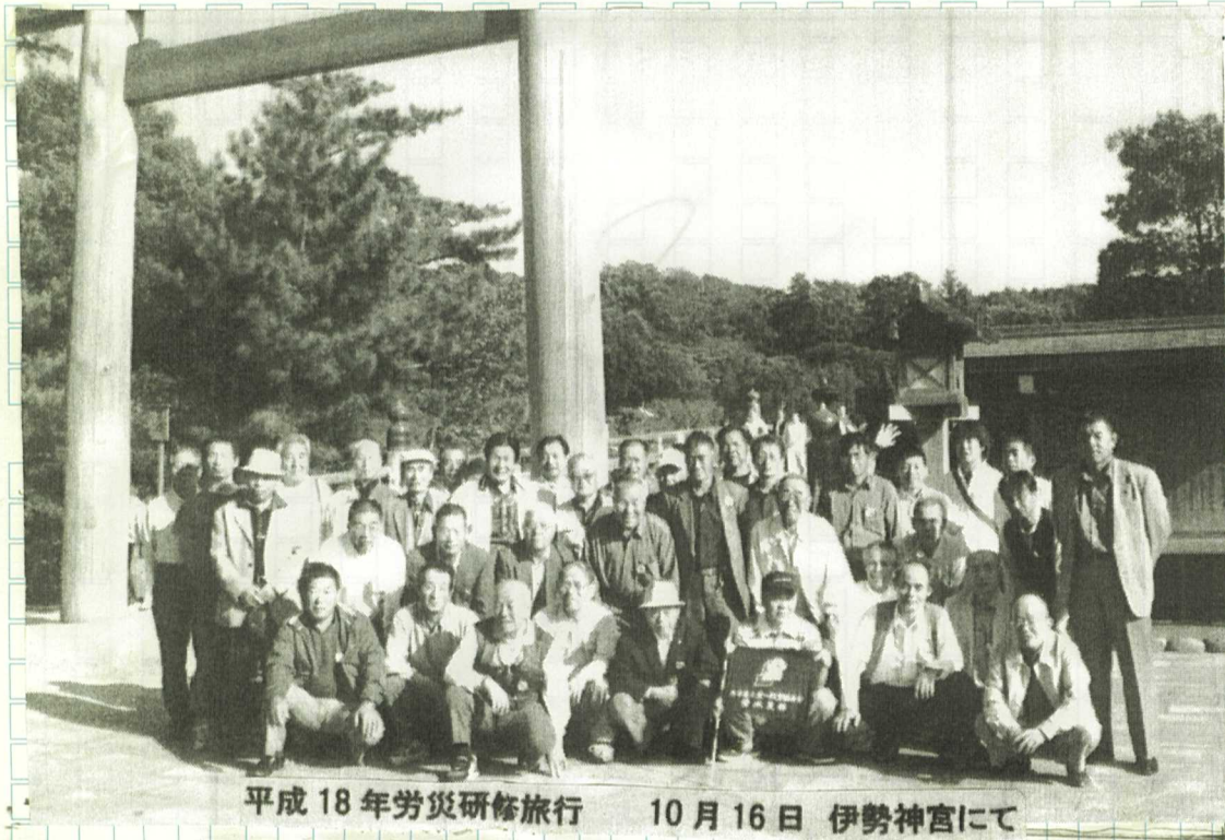
平成18年労働災害研修旅行 10月16日 伊勢神宮にて

ることが出来、改めて私達組合員の置かれている環境に愕然としました。政府の対応の悪さに皆さん、こぶしを