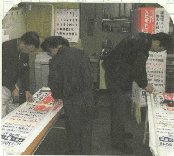
看板作りに励む組織部員