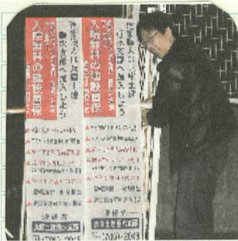
看板を立てる第1分会員