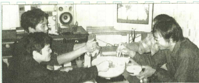
友と囲む鍋はうまい