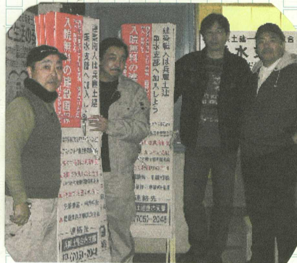
今から立てに行くぞ!