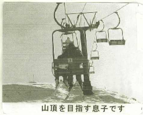
山頂を目指す息子です