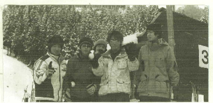
息子とその仲間です

レンドが閉鎖されている状況でしたが、逆にスキー客が敬遠し少なく十分に遊ぶことが出来ました。そして今回も誰も負傷すること無く無事に過ごせました。私も50代になり若いときのように無謀な滑りは無理になってきました。スキーは