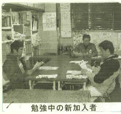
勉強中の新加入者