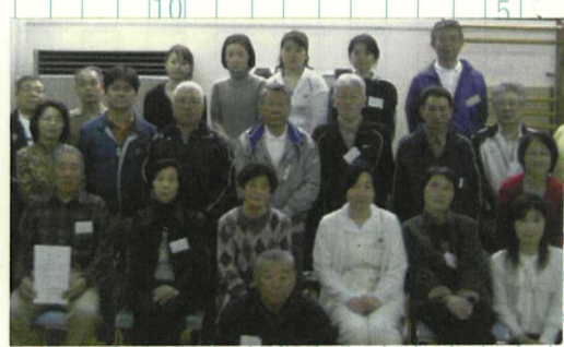
健康づくり 支援講習会