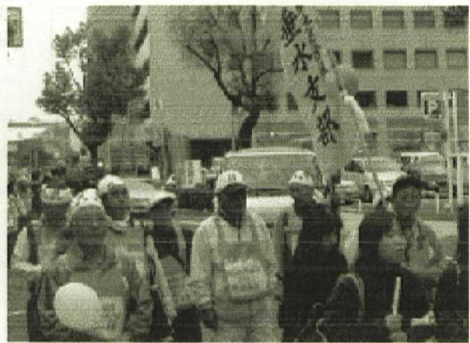
県庁めざして デモ行進

3月25日(日) 神戸市役所南側の東遊園地にて神戸地区決起集会が開かれた。 参加総数1581名 (垂水支部149名)