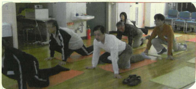
気持ちの良いストレッチ