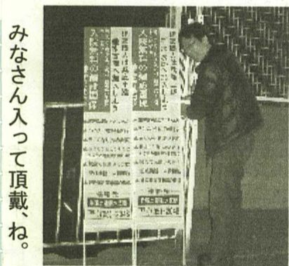
みなさん入って頂戴、ね。

皆さん、お元気ですか? 又、組織拡大月間になりました。 今、兵庫県建組織数が三万人を割ってしまっています。組織数が減ると、政府の助成金も減ってきます。我々支部役員も頑張っていますが、皆さんの力が必要です。宜しくお願ひします。