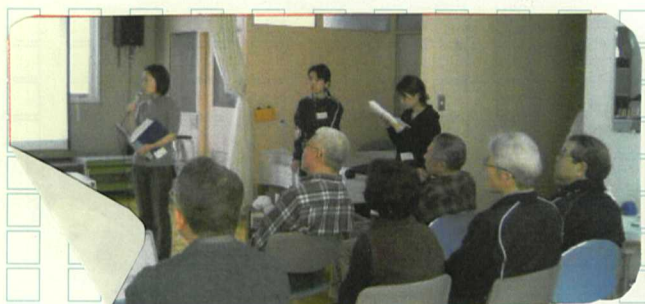
担当者から指導を受ける

15 院長先生の講義とストレッチによるストレスリリーフによるストレッチ体操で幕を開けた講習会、さて次は自分の娘ぐらいの年頃の担当から今後の指導を 10 受ける事になった。私の場合、体重10キロと腹囲10センチ減に目標を設定した。それにより一日2000キロカロリー以上は摂取しない。仕事以外に毎日6000歩。体重、腹囲、血圧、3食分のカロリーを毎日記録し、舞子台病院の担当者に1週間分のデータを送信しなければなりません。やる気は余りなかつたが担当者の励ましの返信もあり頑張つて見ようかな? 続