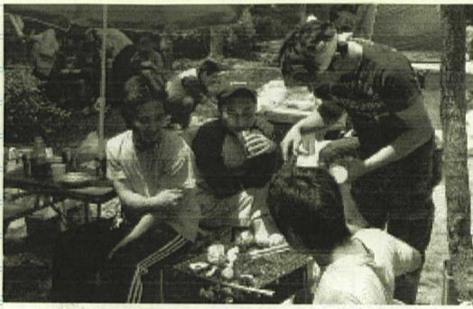
さあ～！みんな食べようぜ！

朝少し雲っていましたが、たくさんの方が参加してくれました。とてもいいレクリエーションだったと思います。