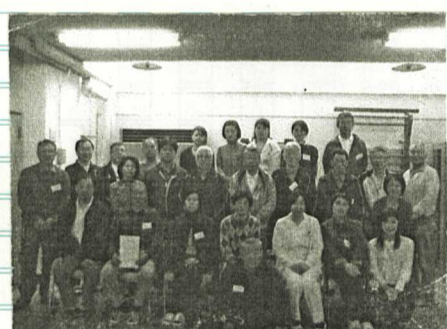
④メタボリック症候群の皆様方