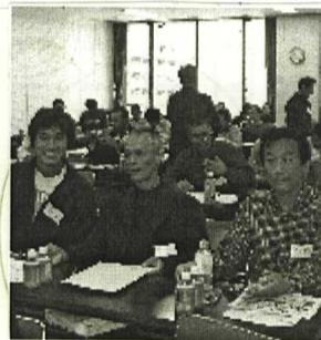
分りやすい勉強会でした

平成19年10月9日、「兵庫県私立中学高等学校保護者会連合会」は、国や地方公共団体に対する私学助成を中