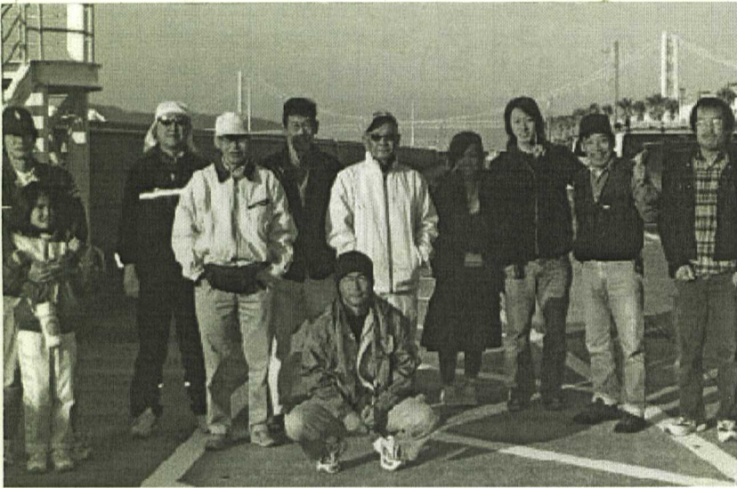
大会前の記念撮影「今日はガンバルぞ〜」

発行所 〒652-0802 神戸市兵庫区水木通5丁目2-9 兵庫県土建一般労働組合 TEL 078 (576) 6721(代) FAX 078 (576) 6726 http://www.hyogodoken.or.jp 編集人 教宣部長 (釜友勇) (組合員の購読料は組合費に含まれています)