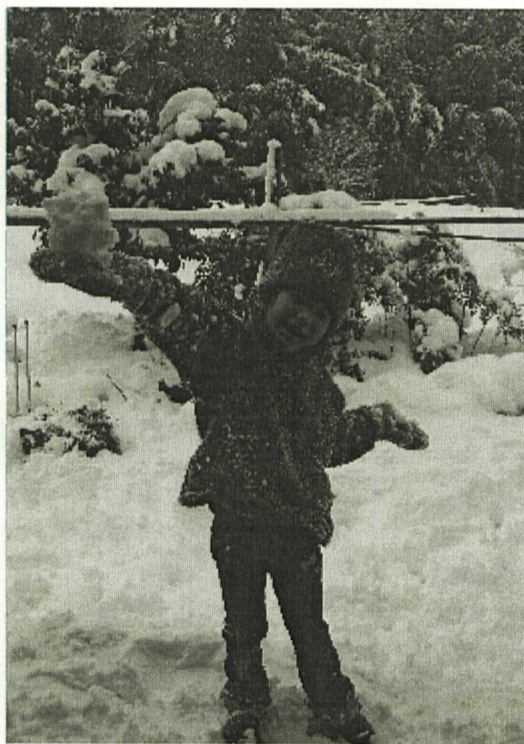
見て~。小さい雪ダルマ~