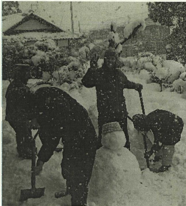
特大 雪ダルマを作るぞ。