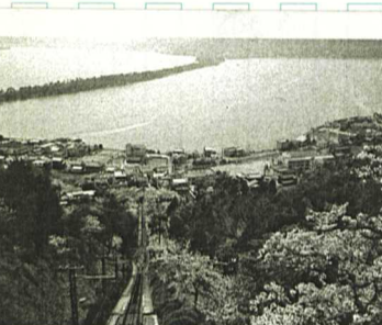
笠松公園頂上から一望

ろ見学し感動、カモメ やトンビも私達を歓迎 子供達はむむせんを投 げあい喜び、船上での楽 しーひとときでした。 知恩寺では全員でハ イチーズ、今日は最高 に楽しかったよー。