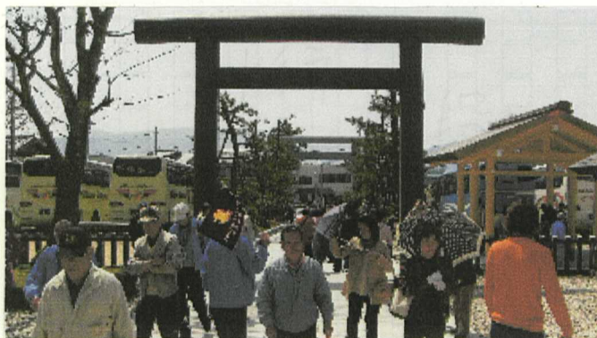
でっかい鳥居だね!

ぐま水参加された皆さ んが大変嬉しそうでし た。さあ出発だ、まず は天橋立笠松公園めぐ して、道中車窓から見 えた桜にまず目が釘づ けに「あーきれいやな ー」皆さん観音・笠松 公園山頂では天橋立と 満開の桜の二本立ての 景色を満喫バリーグー。