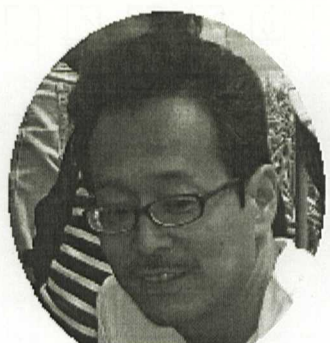
今のところ無趣味ですハイハイ

4月1日午後7時頃から、垂水駅前にてティッシュ配りをしました。みなさん快く受け取ってくれました。ティッシュ配り本当にご苦労様でした。