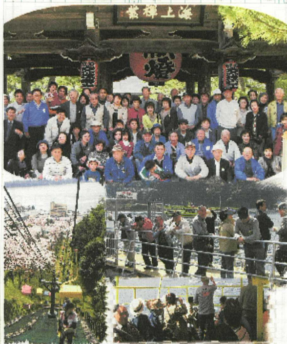
とっても楽しい旅行でした!