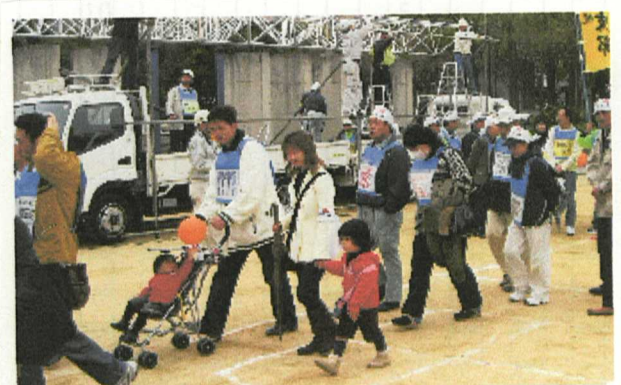
デモ行進にしゅっぱーつ!

してたんだ。1年前までの私は何で年末に保険証の切替えなんか行かなあかんねん、めんどくさいな。と思っ ていたごく一般的な組合員でした。それがなぜか役員になり、こんな深夜に今まで書いた事の無い連載物を書くうとは。支部や分会の幹事会に出て、この1年で土建組合にもメリットがあるんだと(拘束される時間もかなり増えましたが)思えるようになりました。頑張りましょう。