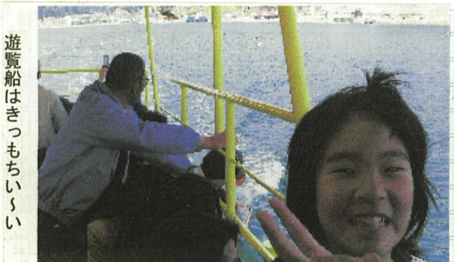
遊覧船はきつもちいさい

ぐま水参加された皆さ んが大変嬉しそうでし た。さあ出発だ、まず は天橋立笠松公園めぐ して、道中車窓から見 えた桜にまず目が釘づ けに「あーきれいやな ー」皆さん観音・笠松 公園山頂では天橋立と 満開の桜の二本立ての 景色を満喫バリーグー。