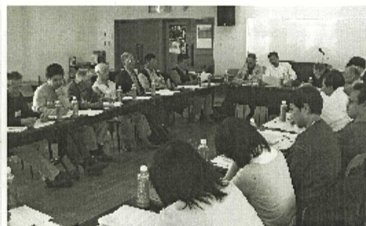
1分科会の会議の様子。

支部・分会の実情、将来の方向性など、意見及び討論は、支部・組織部にとって大いに参考になりました。今後、新旧入りまじって活発な意見を出し合い、盛り上げていけば、支部・分会共に発展していく会議だと信じています。