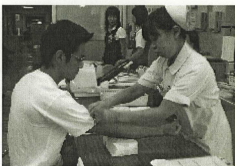
健康は自分で管理

申込み 申込み期間は支部受診日の1週間前まで。ただし、定員になり 次第締め切ります。 所属支部窓口に受診料を添えて早急に申し込んで下さい。 詳しくは「建設ひょうご」今月号に、「健康診断の案内 (申込み用紙含む)」を折込しますのでご確認願います。