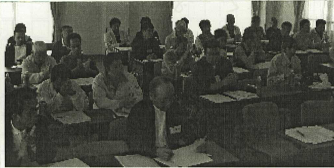
さあ、活動者会議の始まりだ。

支部・分会の実情、将来の方向性など、意見及び討論は、支部・組織部にとって大いに参考になりました。今後、新旧入りまじって活発な意見を出し合い、盛り上げていけば、支部・分会共に発展していく会議だと信じています。