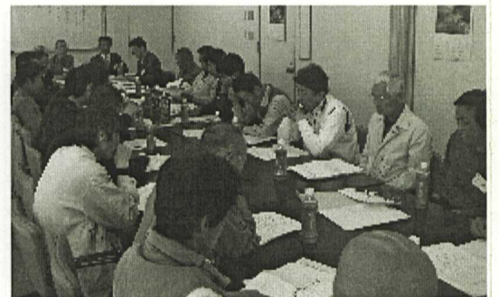
2分科会の会議の様子

私の... 糖尿病の疑い... 5 (一病息災) 私が病気になるまで、20年いや25年かなし。ある日嫁が少しやせたのと違う、と声をかけてくれた。その時は別に自覚症状もなく、気になしなかつたが、一度病院で検査をしたら、すると貴方は糖尿病の疑い有り。と云われ血糖値は220で普通は80程度、1週間程して体験入院せよと言われ、食事療法を体験10日程で退院した。其の後、勤務していた会社は倒産し、自営にて営業開始、当時長男が大学2年、娘が高校3年、全ての面において苦しい日々も有り、其の後同業者から話があり自営業から会社勤務になるか、心労が重なりダウン再び入院。現在は1日1800カロリで我慢の生活、タバコもやめて3年、他の病気もなく、体調もよく元気で頑張ってます。 第3分会 山本