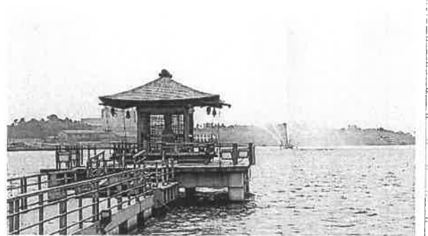
片山津温泉近くの柴山湯