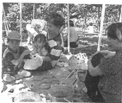
たくさん食べれたかな?

ぶどうを堪能した後、いつものビンゴ大会でした。今回は商品も多く、みんなに景品が行き渡りました。みんながほっこりしたひと時でした。