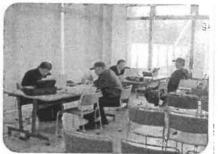
スムーズ スムーズ

垂水支部厚生部として、2月の確定申告相談会の受付の手伝いを 5日間で延べ129人の相談がありました。 数年前に比べると相