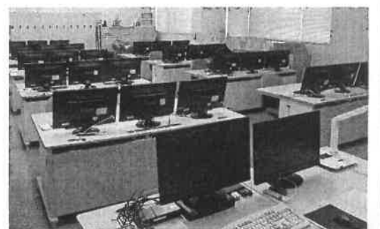
実践コースの教室

1月19日、20日(初心者コース)2月17日、24日(実践コース)と組合の本部住技対部主催のCAD講習会に参加しました。