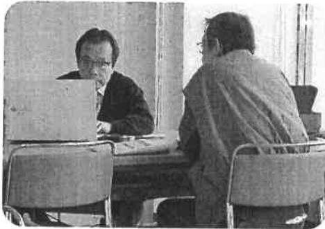
もうちょっと負かりませんか

5日間の開催というところが、厚生部員としては重荷ではありませんが、皆様の生活にあって、有効活用できる組合組織であればと思います。