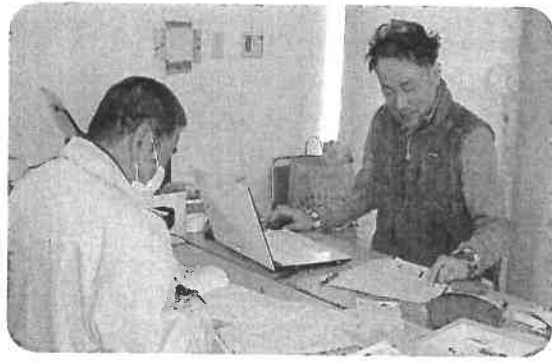
今年はいよいよわかりましたな