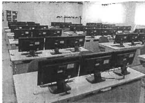
初心者コースの教室