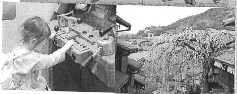
わたしのコックピットよ