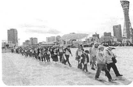
みんなで行進だー

初春を感じる3月24日、3・24賃金・単価引き上げ神戸地区決起集会に参加しました。 集会では建築業界の現状や近い将来に起こりうる問題が提議され、今こそ一致団結し諸問題を解決していかねければならないと思えました。 ガンバロー三唱後、デモ行進はメリケンパークを出発しました。アスベスト対策や公契約条例の制定などのシユプレヒコールを