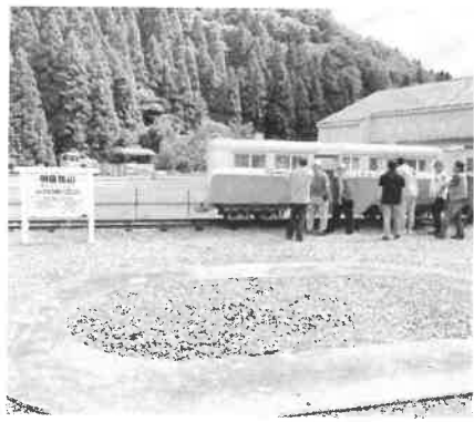
かつて活躍した円電車

塩屋分会レクリエーション ほってほっておおあばれ 来年はもっと多くの仲間と 9月29日(日)小東野農園にてもほりをしました。数日前の天気予報では雨予報でしたが、当日は快晴で暑いくらいでした。