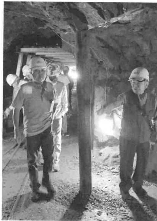
えっ!?作業員の方ですか?