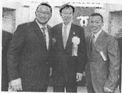
俺たちも市長めざします！