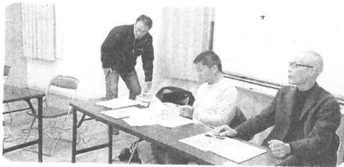
みなさんわかりましたかー