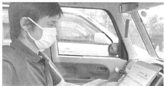
車内で問診表を記入中