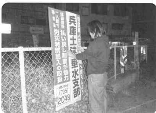
初秋の宵闇に(過去の活動から)

垂水支部の組合員数も1000人の大台を突破してからは、しばらく伸び悩んでいます。いろんな現場で、仲間健康保険や労災保険に加入できるなどのメリットを宣伝し、加入につなげましょう。