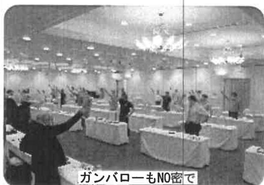
ガンパローもN0密で

の参加でした。議事は滞りなく進み組織拡大目標達成表彰では、多聞、名谷、垂水東各分会が目標達成し、表彰されました。組合員はこの1年間で9人減少し、合計95人となりました。組合を取り巻く状況は厳しいですが、みんな