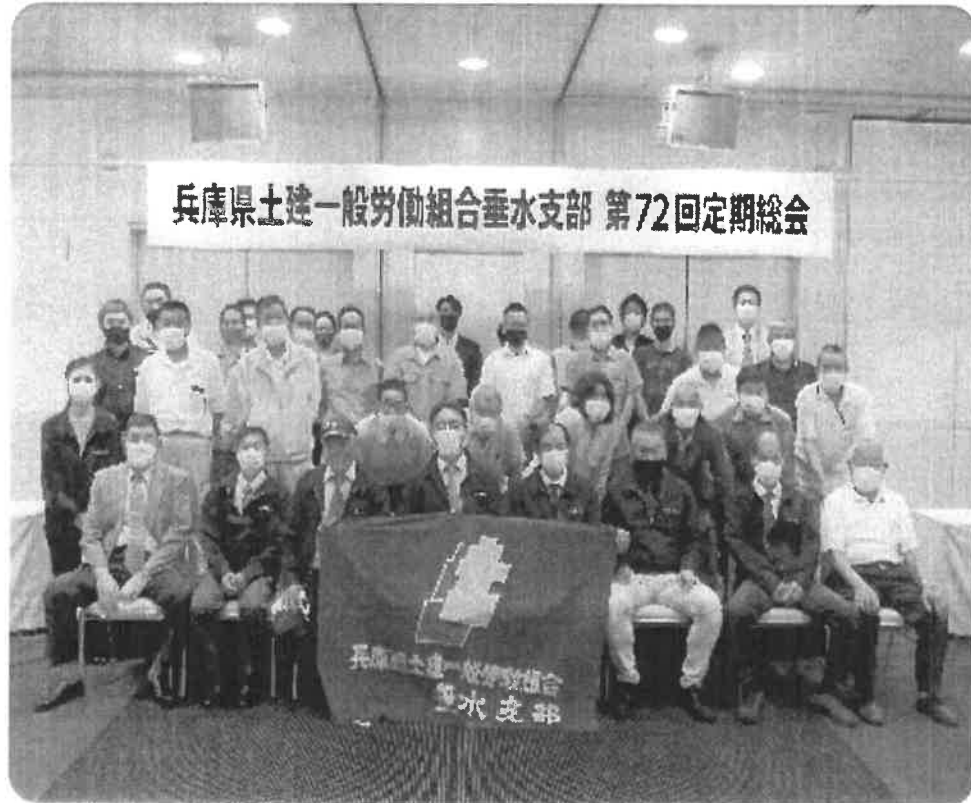
兵庫県土建一般労働組合垂水支部 第72回定期総会