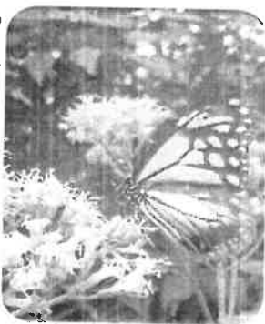
これぞ自然の造形美

ったアサギマダラに出会い、神秘の蝶のその優雅な姿にしばし見とれました。 神田 記