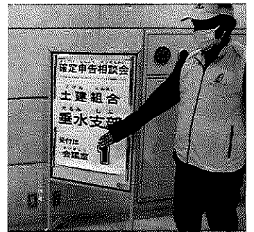
会場はこちらですよー

確定申告書作成相談会 安心して申告 2月6日・13日・15日(レバンテ垂水区役所に3階)で確定申告書作成相談会を行いました。参加人数は3日間で109人でした。垂水区文化センターでの開催は二回目です。今回も三部屋に分けて行いおおむね混雑せずに行いました。今年の10月からインボイス制度が始まるなど税制が変わっているため、何か分からないことがあれば次回利用してみてください。