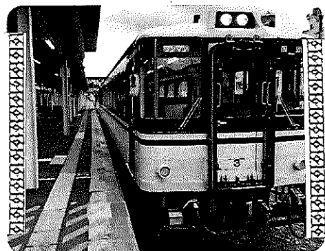
智頭からは智頭急行 HOT3500に