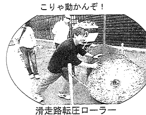
滑走路転圧ローラー