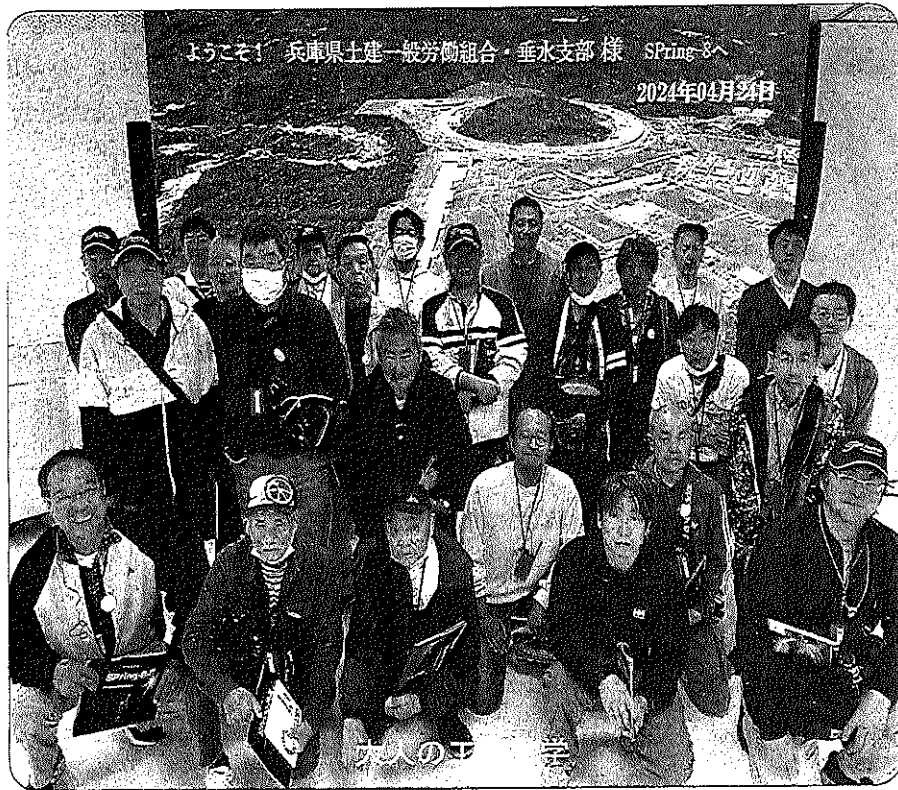
ようこそ! 兵庫県土建一般労働組合・垂水支部様 Spring 8へ 2024年04月24日