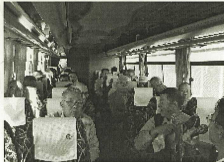
講師の方ご苦労様です

11月4日垂水区五色山の 建設現場で、作業道具を 盗まれる事件がありました。 被害額として補修したのは、大工 被害総額数十万円。 犯人はまだ捕まっていません 組合員の皆さん、要注意です。