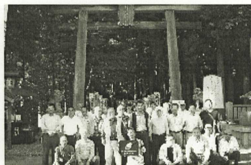
全員で厳粛に記念撮影

の峰温泉で日頃の疲れを癒した。そして最後に高野山で歴史の重さを感じた貴重な2日間であつた。