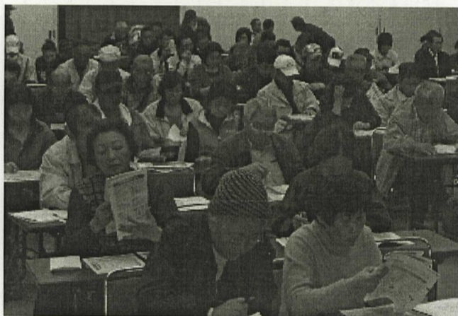
真剣に聞入る出席者の皆さん (2分会・保険証交換学習会風景)

各分 皆さん、保険証交換学 会の役 習会ご苦勞様でした。 員・組 今年は念願のカード 合員の 化にもなりました。