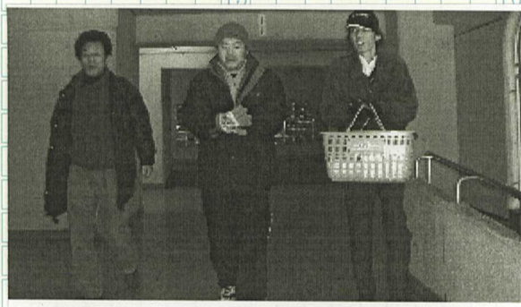
寒い！寒い！ポストは何処？