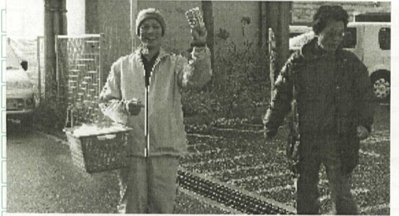
組織拡大をめざして ティッシュ配るぞ！！

寒い日の朝でした。 (前田 記) 空家も多くなかなか思 うようにティッシュ千 枚は捌けないので、残 りは松風台の大型マン ションへ予定を変更し てやっと千枚を無事配 ることができました。