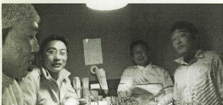
飲みながらも話は真剣