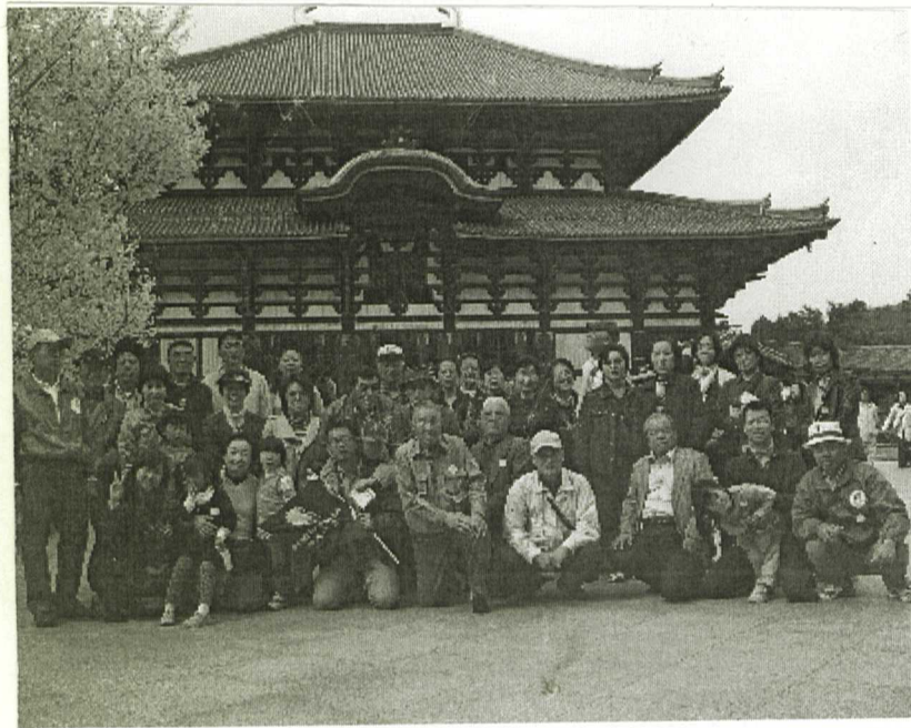
全員集合 記念撮影

支部恒例の春のバス旅行が4月5日(日)に開催され、今回は47名の参加者でした。奈良に向かう途中、支部長挨拶の後、飲物が配られ旅の気分が誘われ、阪神高速、第2阪奈と乗継ぎ奈良市内へ。天気は快晴、桜は満開見ごろ。まずは薬師寺にお参りし、お坊さんの説法を聞くも集合時間が迫り途中で抜け出す結果となり、その後唐招提寺に向い境内を一巡しバスに戻り奈良公園に向かいました。途中平城京朱雀門をチラ見し、若草山近くのレストランで昼食をとり午後は東大寺に参拝。木造建築最大級の大仏殿で柱の太さ、瓦の大きさに感動しました。古都奈良には訪ねて見たい神社仏閣が沢山あります。皆さんも訪ねてみてはいかがでしょう。 岡山記