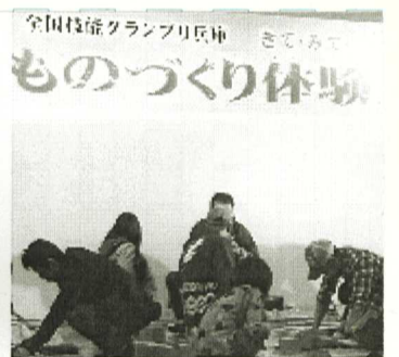
技能フェスタ風景

ふれあい木工教室のミニ椅子作りに、参加しました。指導員は10名4才から10才の子供が対象で、20組の親子が参加しました。2組の親子を指導員1人が指導しながら椅子作りに、頑張って頂きました。小学生は時間内に上手に作りましたが、小さい子供は、少し時間がかかり最後は、みんなに手伝ってもらい何とか完成しました。親子のさすなが一段と深まった一日でした。