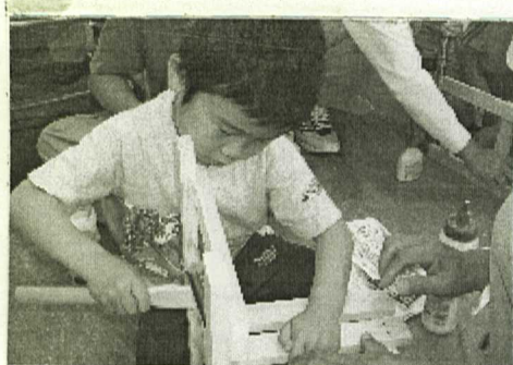
アブナイ手つきだぞ～

★住宅無料相談・親子ふれあい 木工教室開催!! 親子で力を合わせて、 工作、みなさんかん ばって下さい!! とき・5月16日(土) 12時～ ところ・マリリンピア神戸