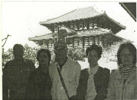
東大寺大仏殿前で「ハイ！ちーず」