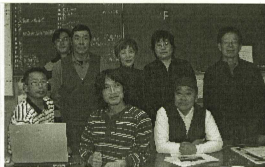
にっこり笑顔のPC教室