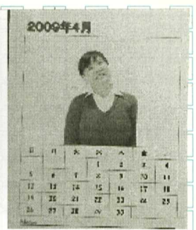
カレンダー出来上がり

3月下旬、垂水支部にてパソコン教室を開催しました。受講者は6名で、オーソシエイプを使ったアルバム作りと、カレンダーを作製し印刷しました。パソコン操作が不慣れな私ではありますが、親切な講師に