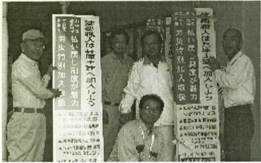
すべて看板で組織拡大