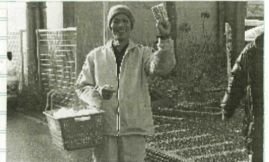
ティッシュ配布で組織拡大