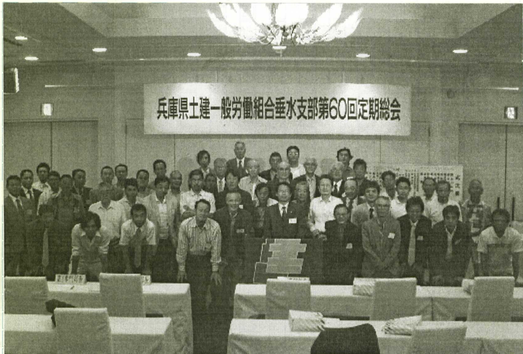
笑顔と和でこれからも垂水支部を盛り上げるぞ

平成21年7月5日(日)にシーサイドホテル舞子ビラに於いて、垂水支部第60回定期総会が70名の出席者を集め開催されました。支部役員の改選、質疑応答、閉会後の懇親会など和やかなうちに終わり、支部のさらなる発展を誓い、有意義な総会となりました。