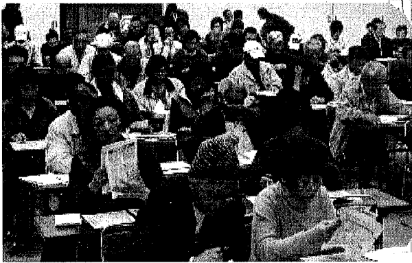
垂水年金会館の学習会

今年も保険証交換の日が近づいてきました。11月15日より各分会ごとに、順次開催されます。日時と場所を確認して間違いの無いように参加して下さい。毎年このことですが、当日には各自で記入した請願ハガキを忘れないようお願いいたします。現在インフルエンザ