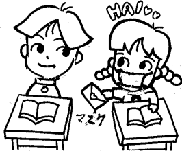
袖耶の里より熱い思いを