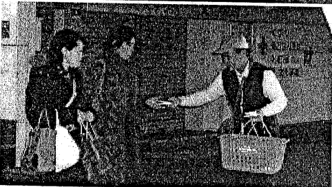
拡大達成の檄と09年度拡大行動

大月間に突入します。 先日の組織拡大推進 委員会に於いて、各分 会の幹事他担当の7名 で拡大宣伝ビラを同封