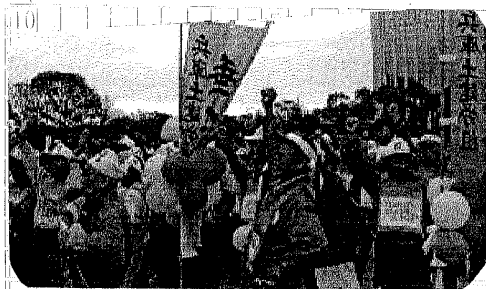
確保にあけて戦うぞ