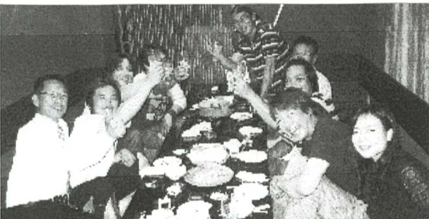
青年部がンバルぞ〜