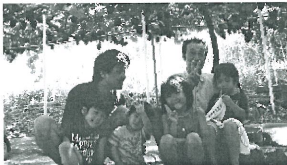
みんなでハイチーズ

す晴天の秋空の下、初秋の訪れを告げるぶどう狩りに行きました。今シーズンでいまが一番いいと言うことと