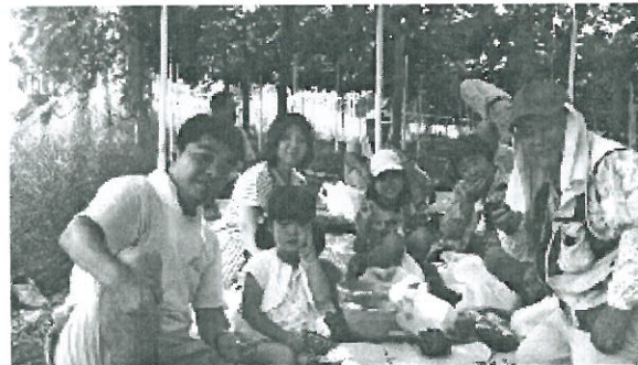
晴れてよかったね

その横では「ハイチーズ」とシャッターを押し笑顔が絶えない盛り上がったひと時でした。帰りは両手に土産付きでとても素晴らしい一日になりました。