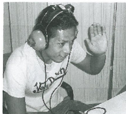
聞こえちゃいました

診断結果は異常なしでしたが、血圧が少し高いと書かれています。受診日前の数日間だけだけでなく、日ごろから