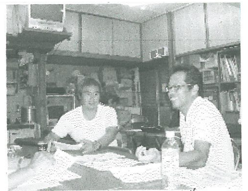
組織部会で討議中