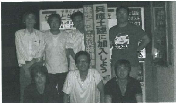
さあ皆ガンパロー

10月と11月の2ヶ月間の秋の拡大月間が始まっています。職人仲間に参加を勧めたい。と、思える組織であるように、ひとりでも多くの組合員を