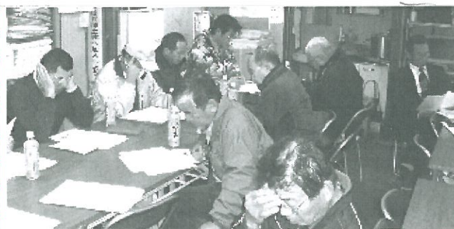
熱心に聞き入る参加者たち