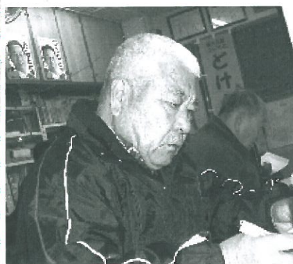
安全に作業するには...