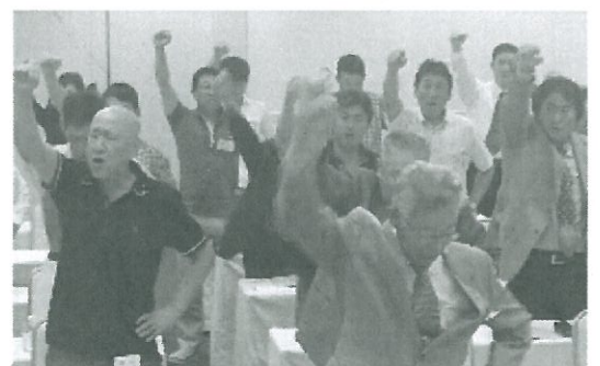
不況に負けずにガンバロー

我々の命を守る要求を実現するためには、一人でも多くの組合員が必要です。改めて、組合の目的を再確認し、尚一層の組織拡大に取り組みなければなりません。 東日本大震災は、自然に対しての従来の概念では、命を守れないということを教えてくれました。 当支部も国民の命と健康を守る技術者として誇りを持ち、国民一人一人の笑顔と共に我々組合員の笑顔を増やしていけるよう取り組んでいきます。 (総会挨拶より抜粋)