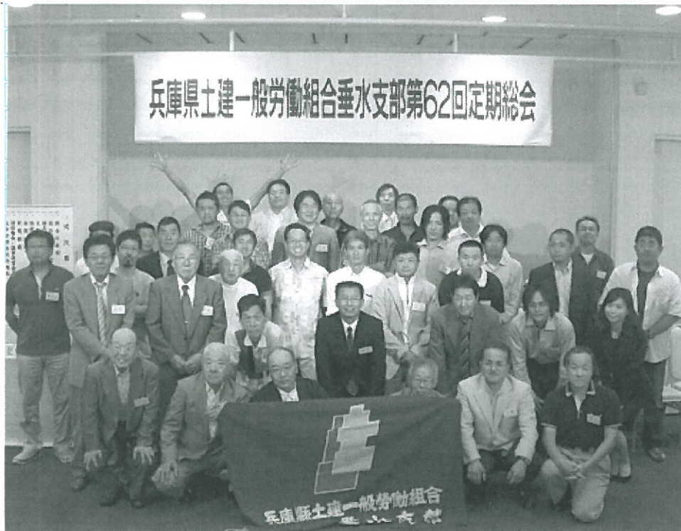
今年もみんなで力を合わせて