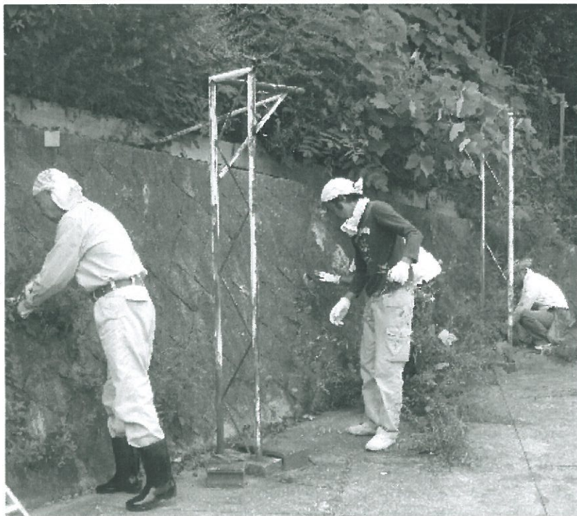
暑い中頑張ってます

7月24日(日)、神戸市立多聞東中学校にて奉仕活動を行いました。作業内容は、里山の整備で今回で3年目になります。晴天の下、7名で作業を開始しました。 暑さが非常に厳しく熱中症などの心配もありましたが、水分を十分にとり塩飴をなめながら頑張つて作業に取り組みました。 午前中はサッカー部、午後からは野球部と生徒会の子供たちが