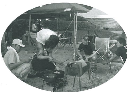
おー 焼けてんのか？