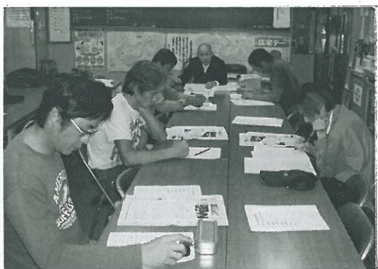
記事の編集、てむずかしいな～