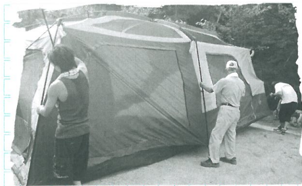
しっかりテント張ってやー